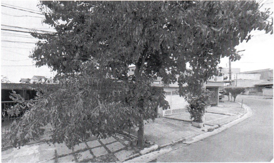
Rua Dos Caçadores, 573 - B. Alvarenga