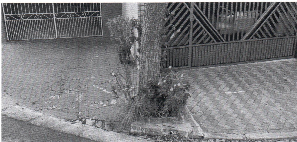
Rua Luis Otavio, 100 – 110 - Bairro Assunção