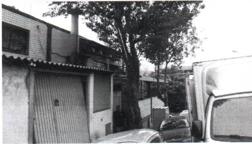
Fotos 1 a 3 – Rua Giovani Bof, 276 – Cooperastiva – Subst. – VCSBC 71275