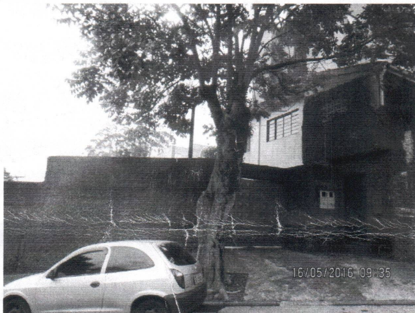
Fotos 1 a 2 – Rua Guimarães Rosa, 427 – Alves Dias – Subst. – SBC 36899741