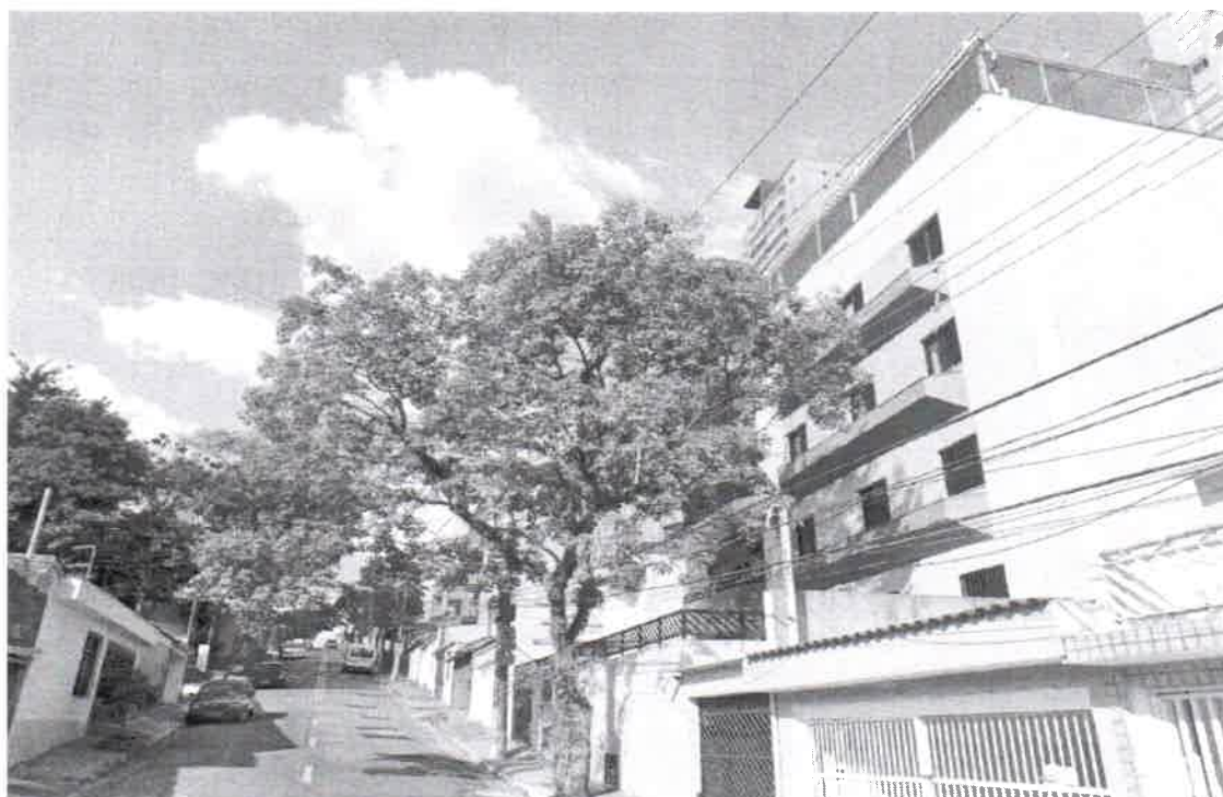
Rua João Cavinato, 230 - B. Centro