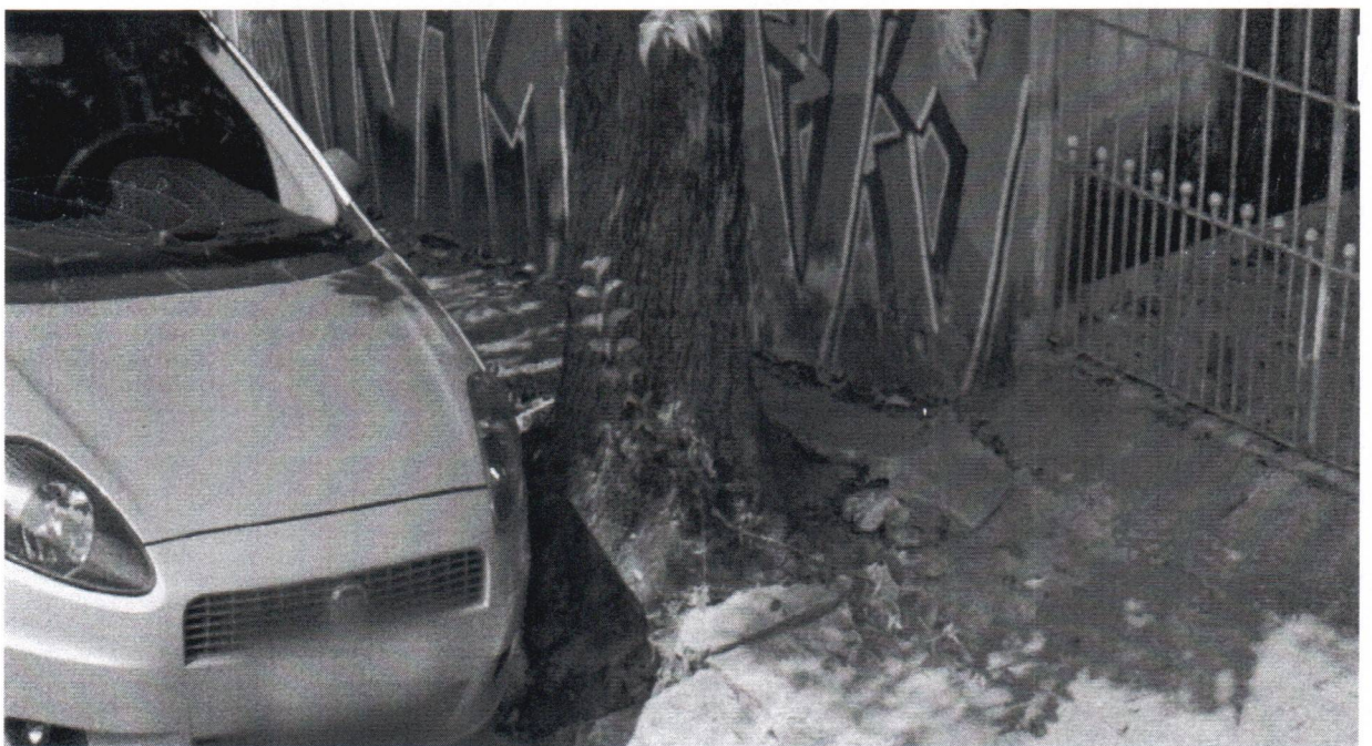
Rua Cristiano Angeli, 307 - Bairro Assunção