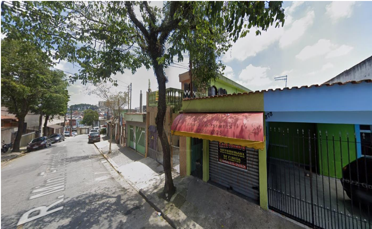
Rua Ministro Frederico Barreto, 373 - Bairro Dos Casa - substituição