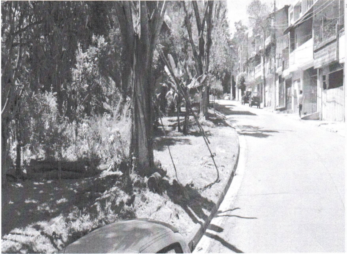
Rua Marli Bezerra da Silva, 46 Lado Oposto - Bairro Botujuru