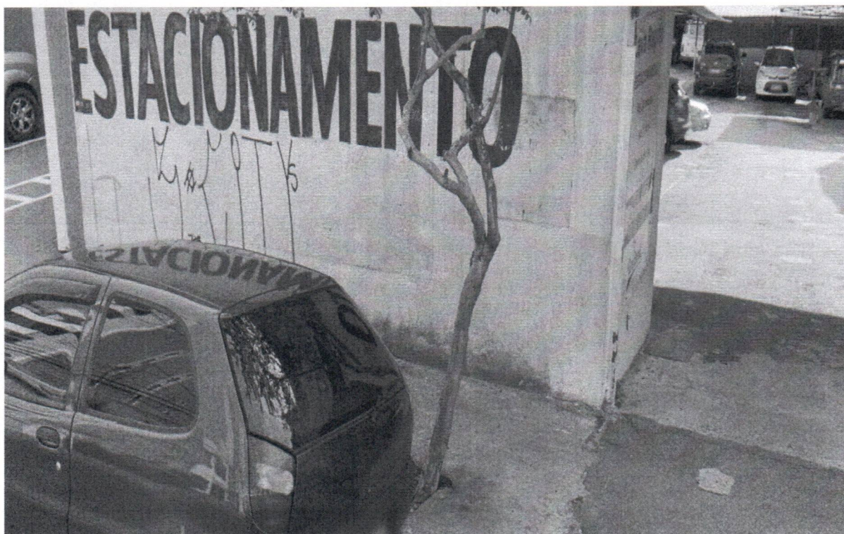
Rua João Pessoa, 440 - Bairro Centro