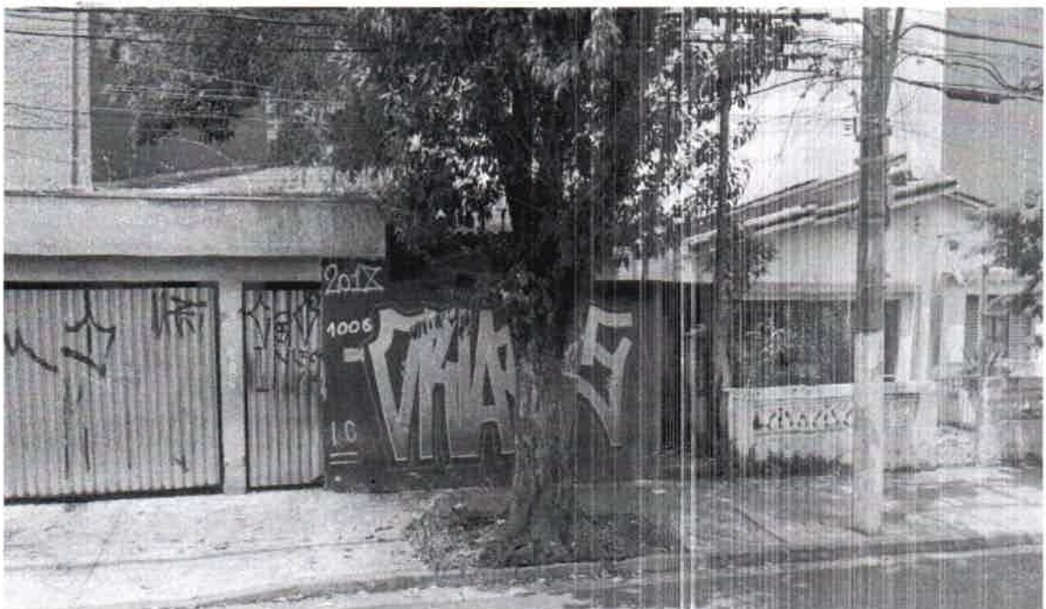
Rua Dos Vianas, 1006 - Bairro Baeta Neves