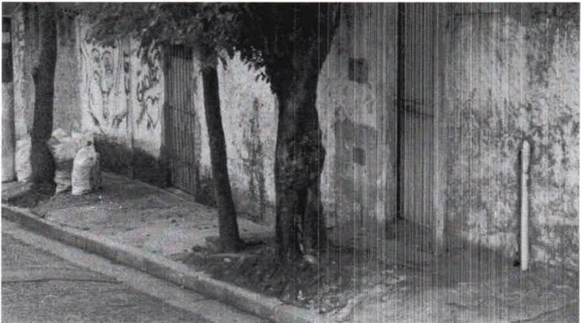
Rua Rita Masine, 239 - Bairro Baeta Neves