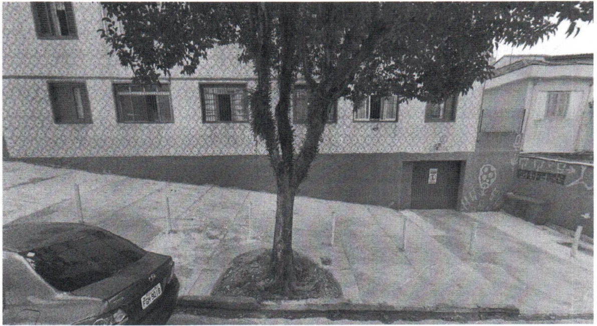
Rua Jacarei, 100 - Bairro Baeta Neves