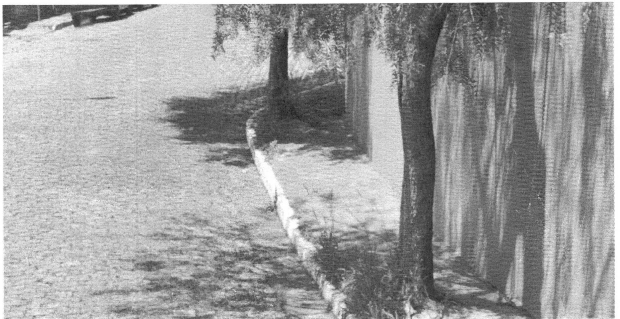
Av. Amazonas, 121 - B. Rio Grande