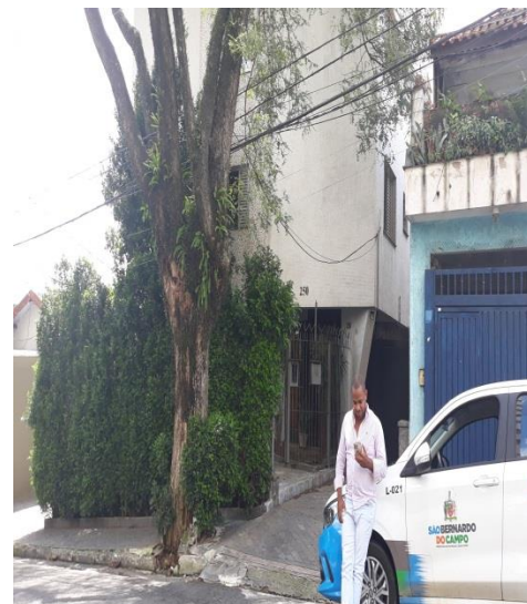
Execução dos serviços