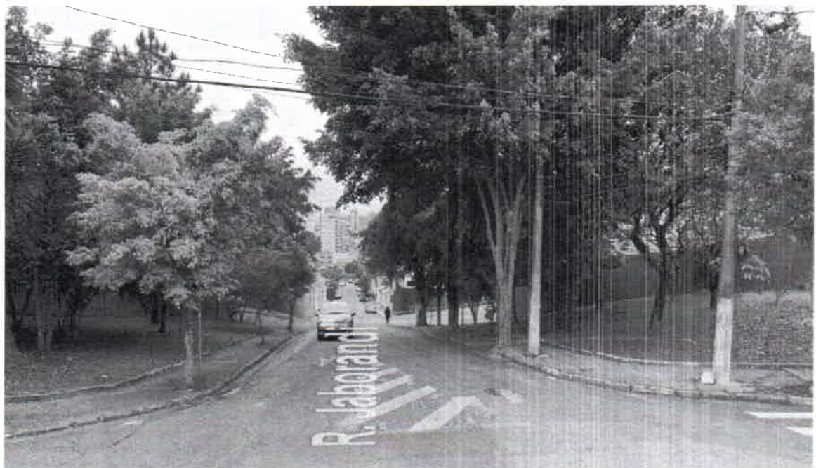
Rua Jaborandi – Passeio Público – Praça Da Colina - Bairro Assunção