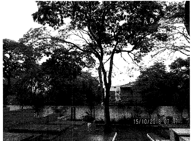
Foto 1 a 4 – Cemitério Vila Euclides, Quadra 17 – Sepultura 640 – Árvore,55 – Remoção Grave –

Compahc - PA/SB 48153/2015-91. – 15/10/18