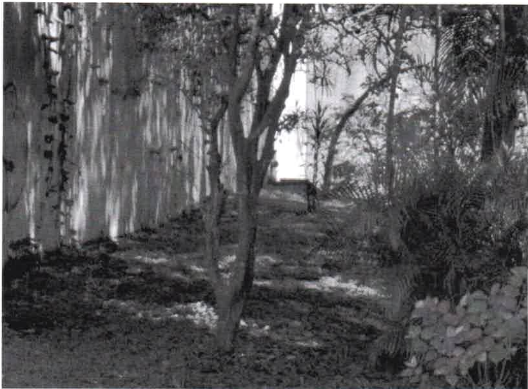
Rua Luis Ferreira da Silva – ajardinamento - praça - Citrús - remoção - sem vida