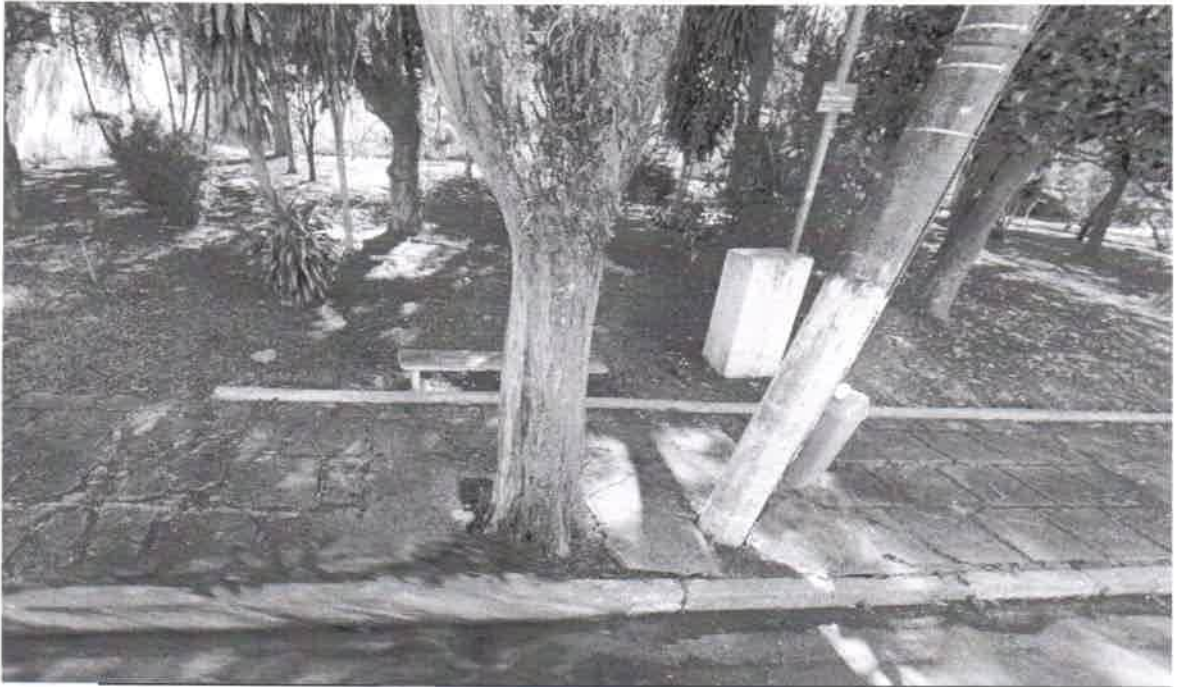
Rua Luis Ferreira da Silva - Passeio público - praça - 01 Sibipiruna - remoção - Poste