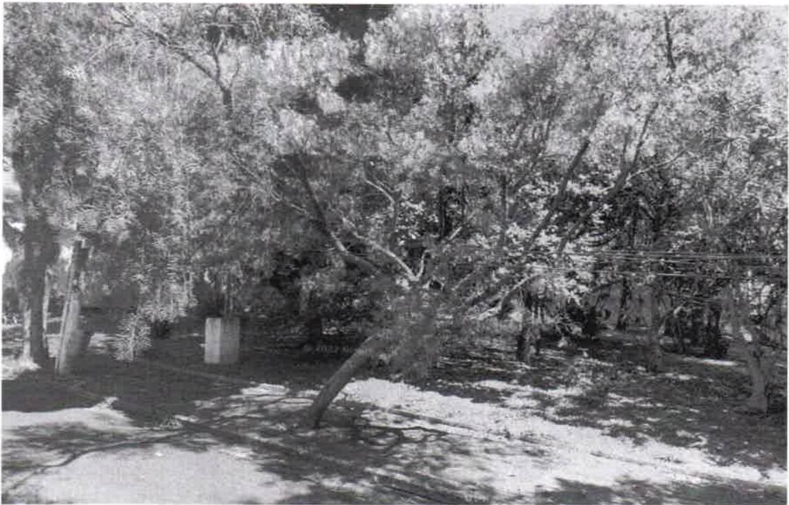
Rua Luis Ferreira da Silva – passeio público – praça – Arueira salsa - substituição