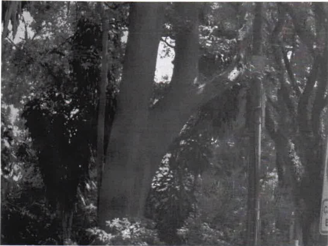
Rua Luis ferreira da Silva - ajardinamento - praça - Paineira – remoção tronco apodrecido