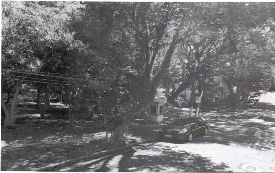
Rua Luis Ferreira da Silva - passeio público - praça - 01 Alfeneiro - substituição