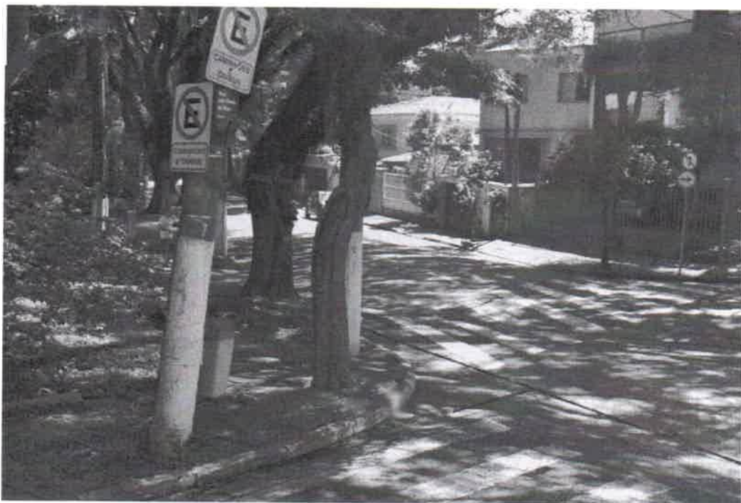
Rua Luis Ferreira da Silva – passeio público – praça - 01 Sibipiruna – remoção - poste