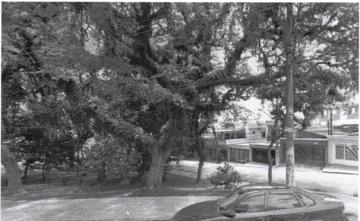
Av. Imperador Pedro II, 1406 – lado oposto – Praça Sérgio Antônio Pinchiar – B. Nova Petrópolis