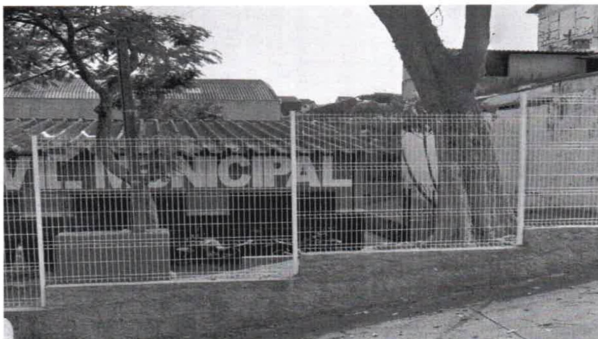
Av. Oswaldo Fregonesi, 101 - GCM - B. Alves Dias