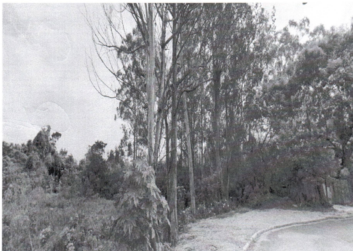
Rua Acrisiatas, altura do Nº 09 - Jd. Canaã - Bairro Batistini