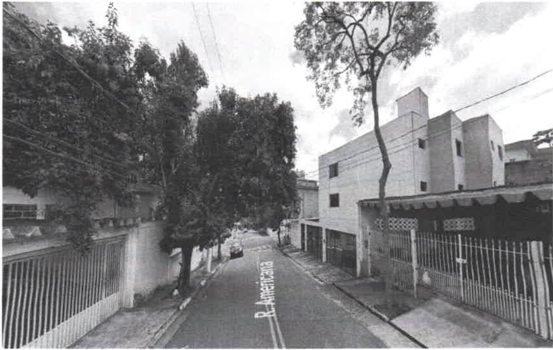
Rua Americana, 121 e lado oposto B. Baeta Neves VCSBC 89779 substituição