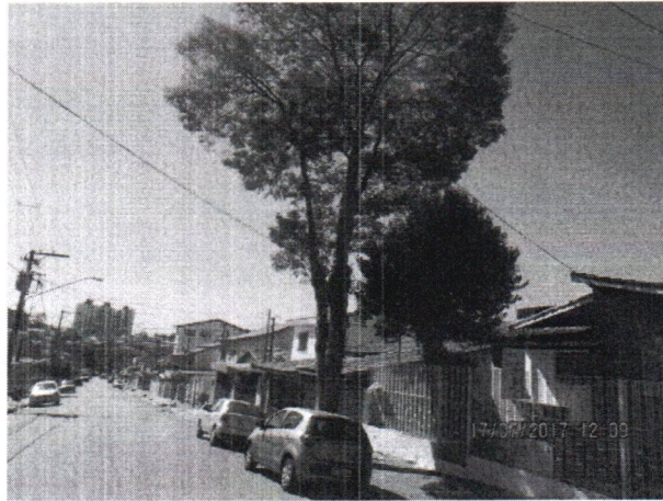
Fotos 1 a 3 – Rua Reverendo Paulo Licio Rizzo, 321 – Alves Dias – Subst. – OF 239-2017 Aurélio