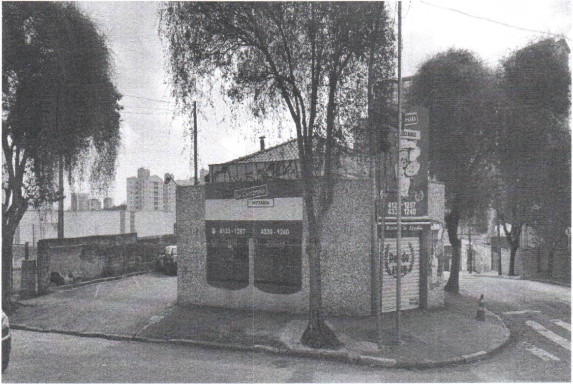
Rua Dos Vianas, 703 Bairro Baeta Neves VCSBC88832 substituição