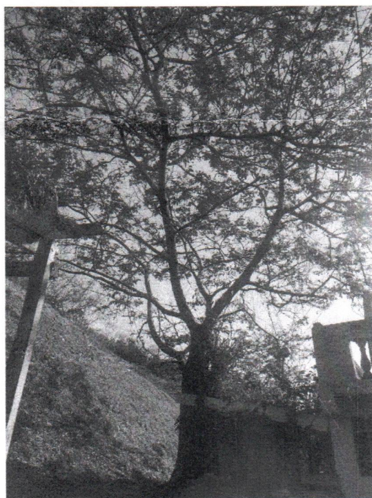
Rua: Joaquim Gomes Miranda, 194 - Montanhão