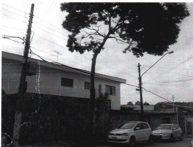
Fotos 1 a 2 – Rua dos Cravos, 366 lado oposto – Assunção – Substituição OF 85-2019