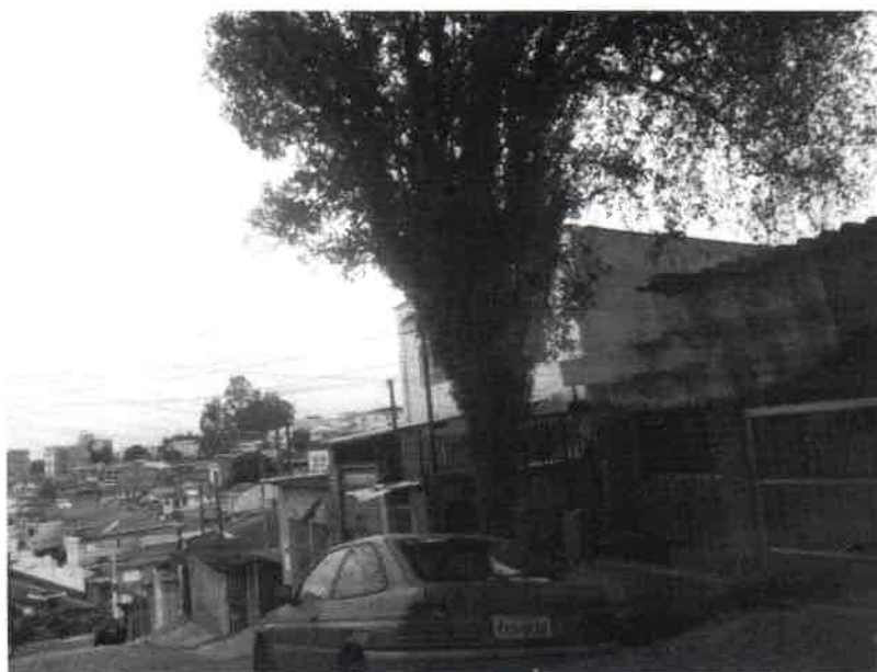
Fotos 1 a 2 – Rua João Zanon, 38 – Baeta Neves – Substituição – VCSBC 82303