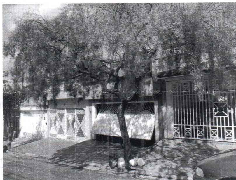
Fotos 1 a 2 – Rua Victorio Natal Gastaldo, 84 – 92 – Nova Petrópolis – Substituição – VCSBC 78630