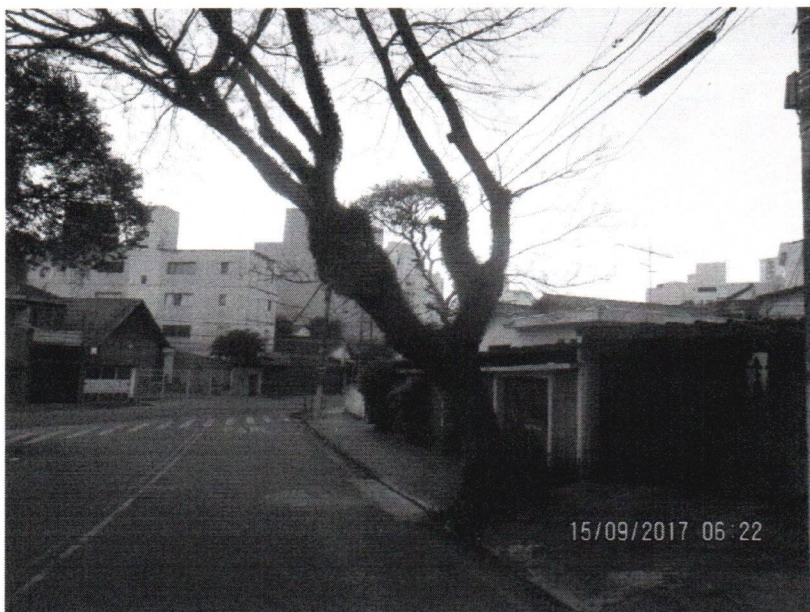
Fotos 1 a 2 – Rua Itú, 574 – Baeta Neves – Subst. – OF 692-2017 Toninho Tavares