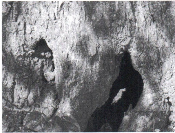
Fotos 1 a 3 – Rua Tiete, 1295 – 1301 – Rudge Ramos – Subst. Grave EM – VCSBC 68291