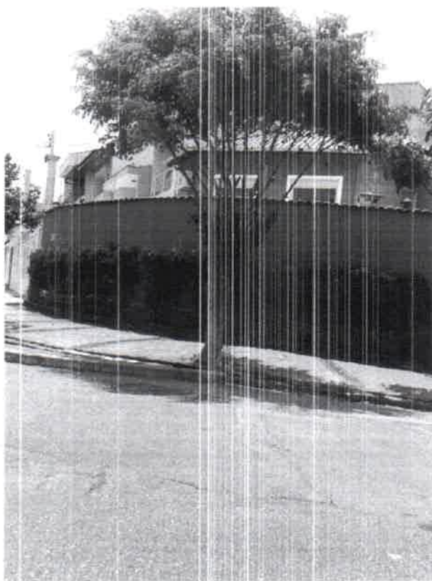
FOTO 1 A 2 – Rua Benedito Luiz Rodrigues, 759 – Nova Petropolis - subst. VCSBC 61651