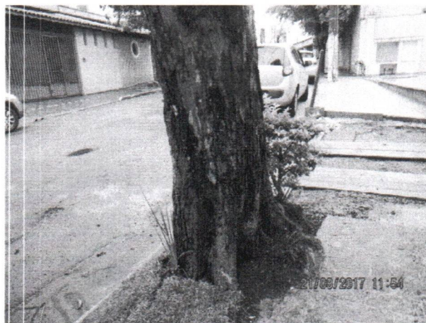
Fotos 1 a 4 - Rua Bahia, 185 - Jordanópolis - Subst. - VCSBC 50929