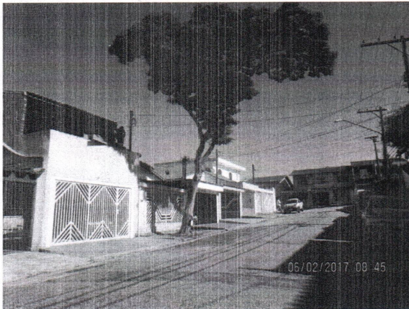
Fotos 1 a 2 – Rua Mario Rocco, 30 – Assunção – Subst. – VCSBC 38626