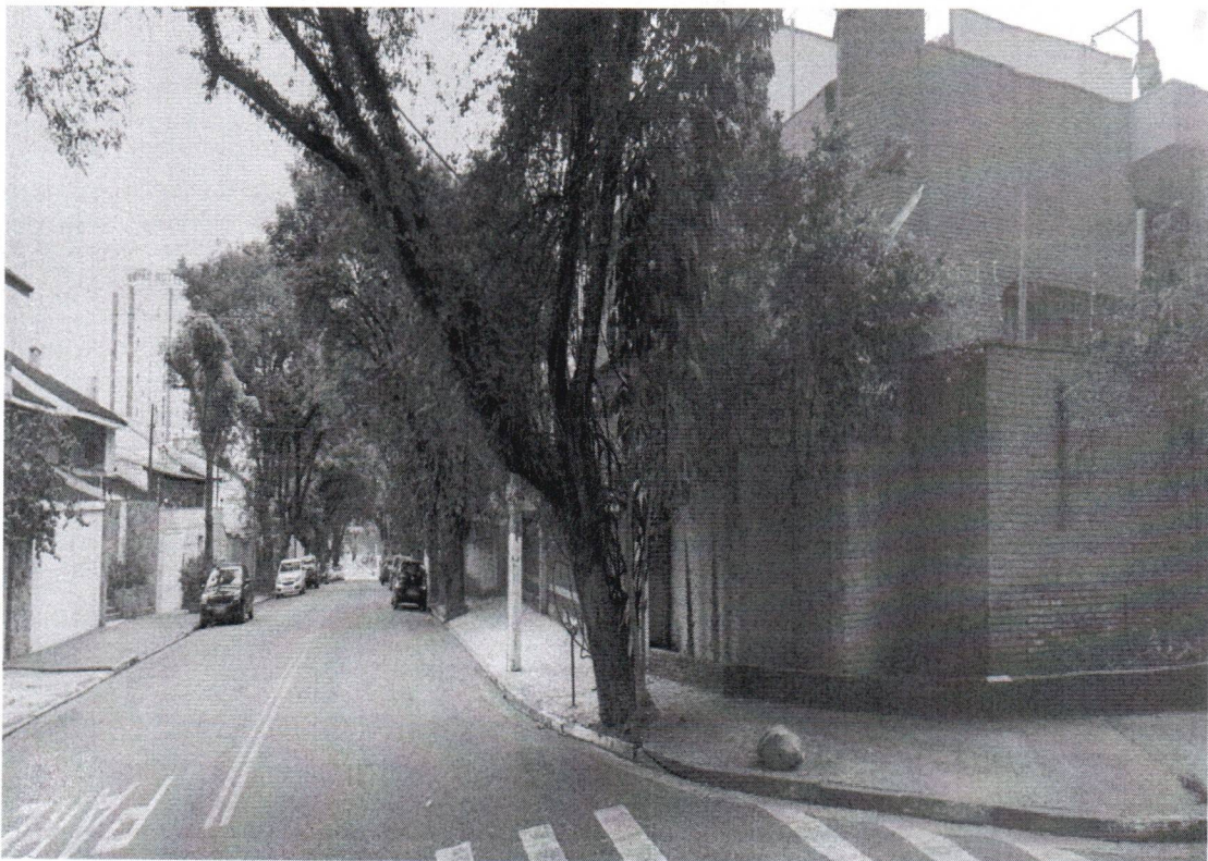
Rua Oswaldo Russi, 161 - Chacara Inglesa - Bairro Centro