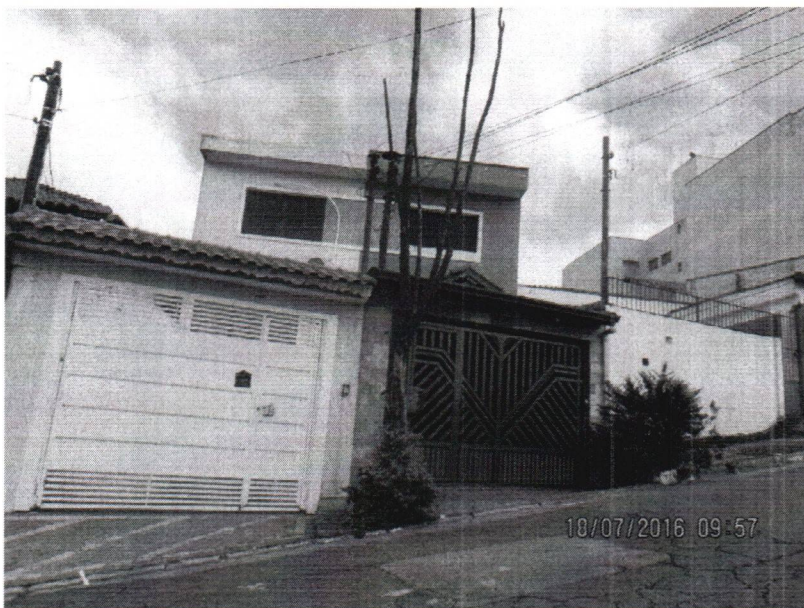
Fotos 1 a 2 – Rua Padre José Leite Penteado, 200 – Assunção – SBC 79407295