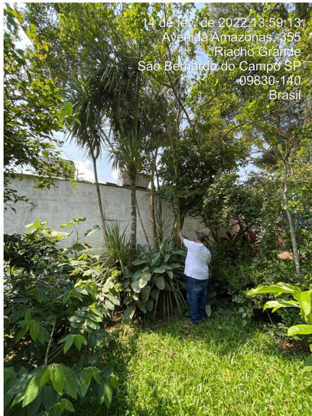
14 de fev. de 2022 13:59:13 Avenida Amazonas, 355 Riacho Grande São Bernardo do Campo SP 09830-140 Brasil