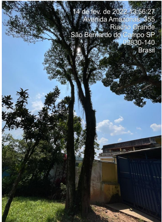
14 de fev. de 2022 13:56:27 Avenida Amazonas, 355 Riacho Grande São Bernardo do Campo SP 09830-140 Brasil