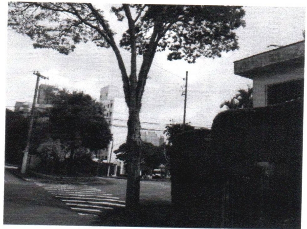
Fotos 1 a 6 – Rua Airton Gomes de Miranda, 312 – Nove Petrópolis – 02 Remoção e 01 Subst. OF 195-2018 Pery