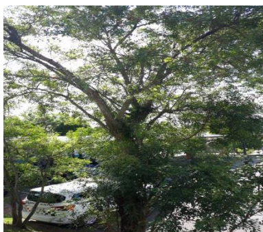
Aroeira pimenteira- Remoção