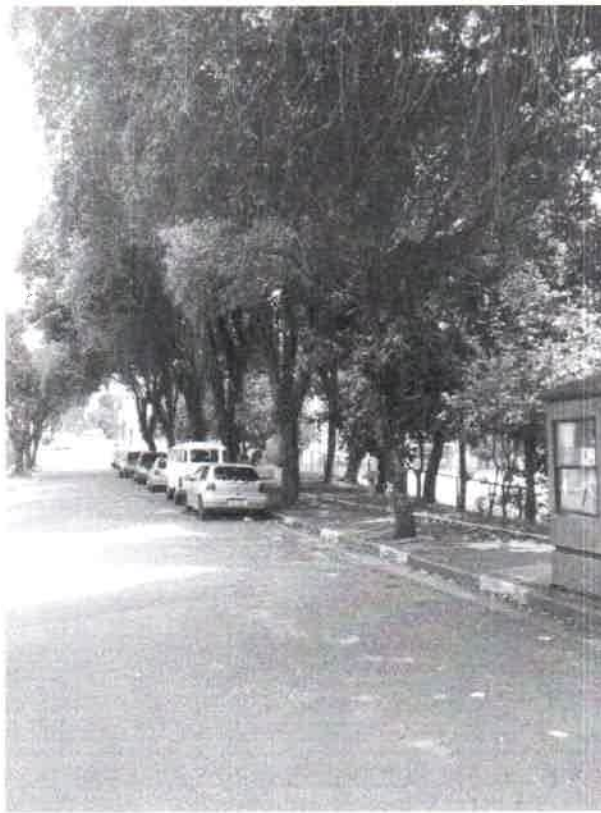
Foto 1 a 2 – Rua Alberto da Silva, 284 Praça – Santa Terezinha VCSBC 61369