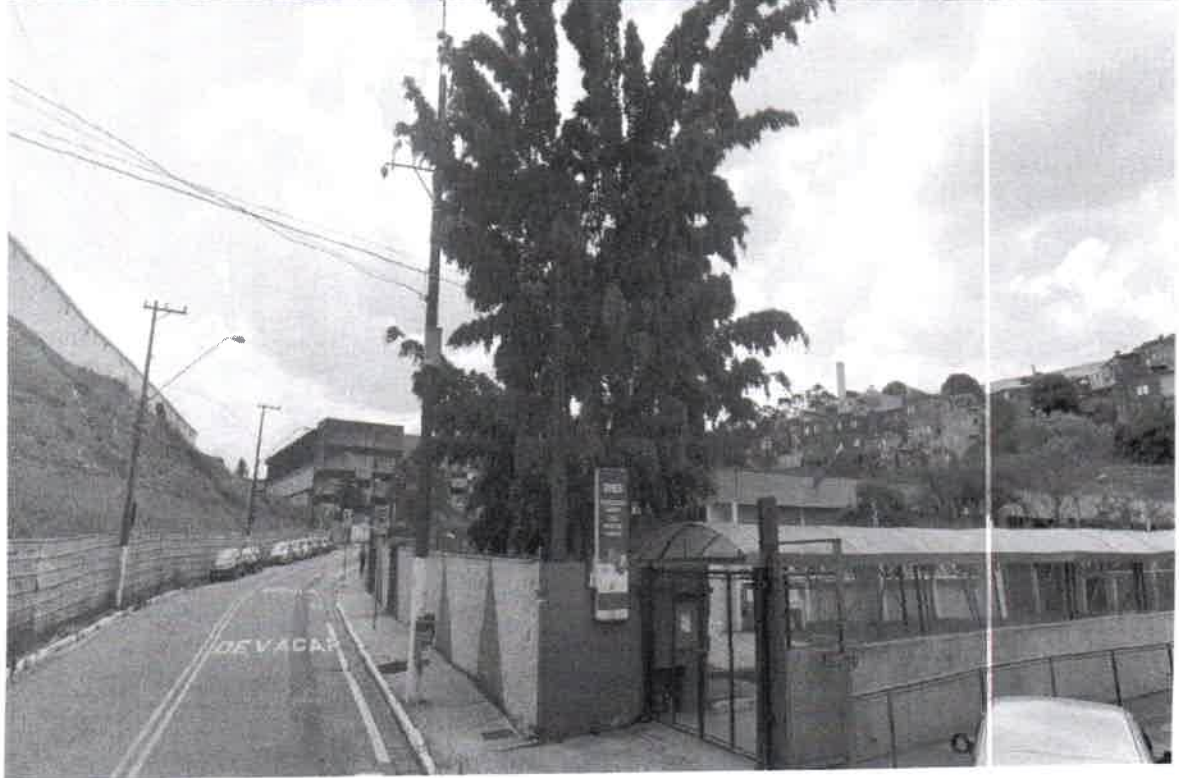
Rua Valdomiro Luis, 175 - Bairro Demarchi