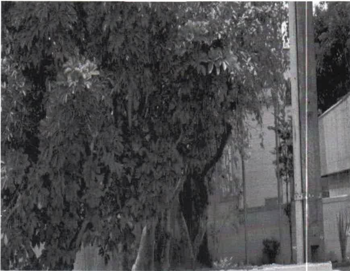
Alfeneiro do Japão - remoção