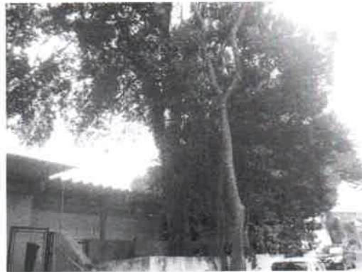
Fotos 1 a 7 – Rua Guadalajara, 510 – Assunção – Remoção – SS 171138-2018