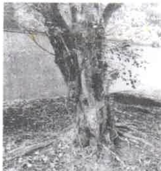
REMOÇÃO( Ficus) – Interno ficus) Interno