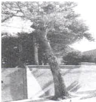
REMOÇÃO (Ipê Rosa ) Passeio Interno