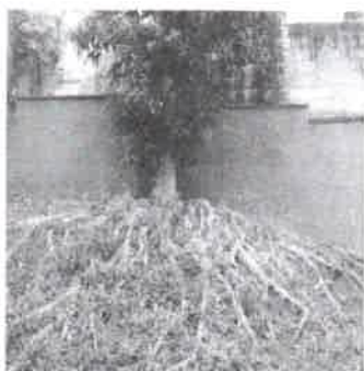
REMOÇÃO( Ficus ) Interno