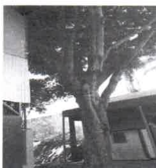
REMOÇÃO ( Ficus) Interno