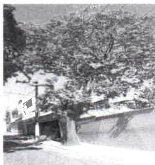
REMOÇÃO (Ipê Rosa) Passeio