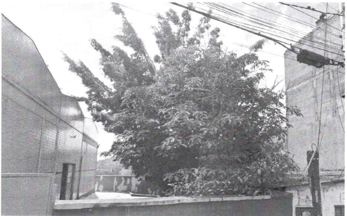
EMEB Profª Alice do Lago Gonçalves Salvador - 01 Abacateiro - 02 Ficus - 02 Nespeira-01 Pinheiro - remoção