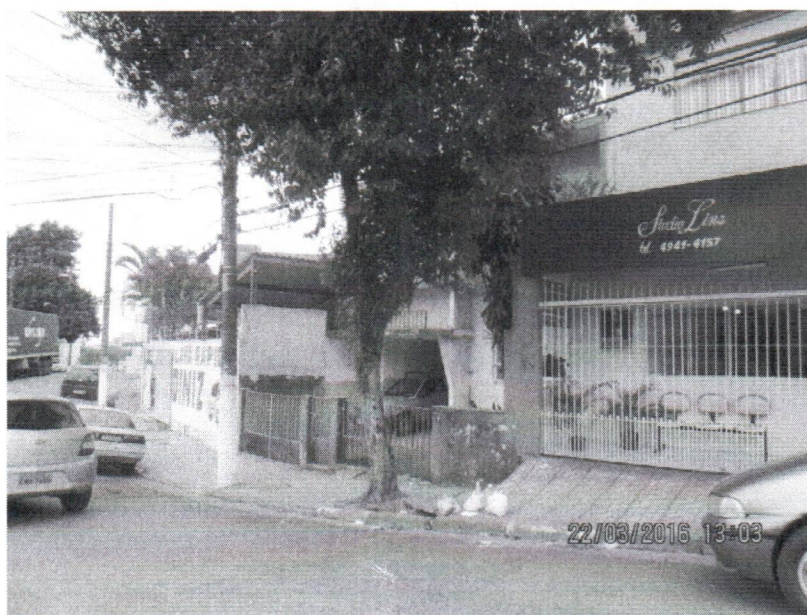
Foto 1 a 3 – Rua Minas Gerais, 293 – Ferrazópolis – Subst. SBC 61273165