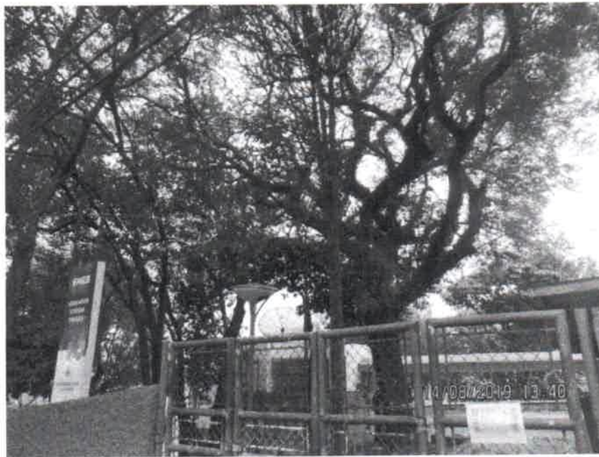
Foto – 1 a 2:- Emeb Kiyoshi Tanaka – Rua João Meneguel, 222 – Bairro Rudge Ramos – SS - 172808 - 2019

( 02 ) Duas Árvores contaminadas , medindo aproximadamente 7,50 m de alt. X DAP 0,50 m. que estão com sem vida orgânica ( Pinnus SPP ) e ( Caesalpinia Pluviosa ) comprometido. Portanto somos favoráveis a remoção.