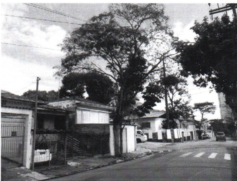
Fotos 1 a 2 – Av. Wallace Simonsen, 950 – Nova Petrópolis – Subst. – VCSBC 66974