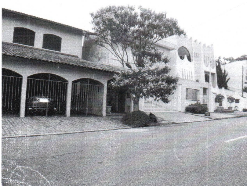
Fotos 1 a 2 – Rua Gabriel de Souza, 910 – Dos Casa – Substituição – VCSBC 75102