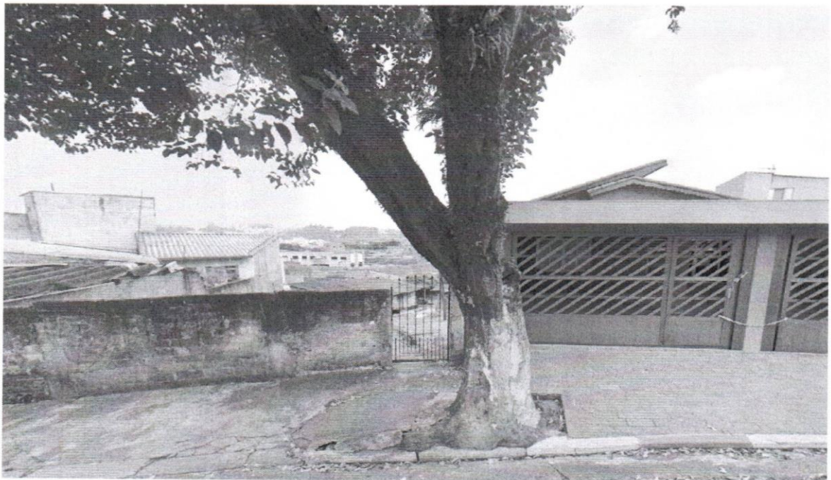
Rua Ministro Ribeiro da Costa, 29 - Bairro Dos Casa