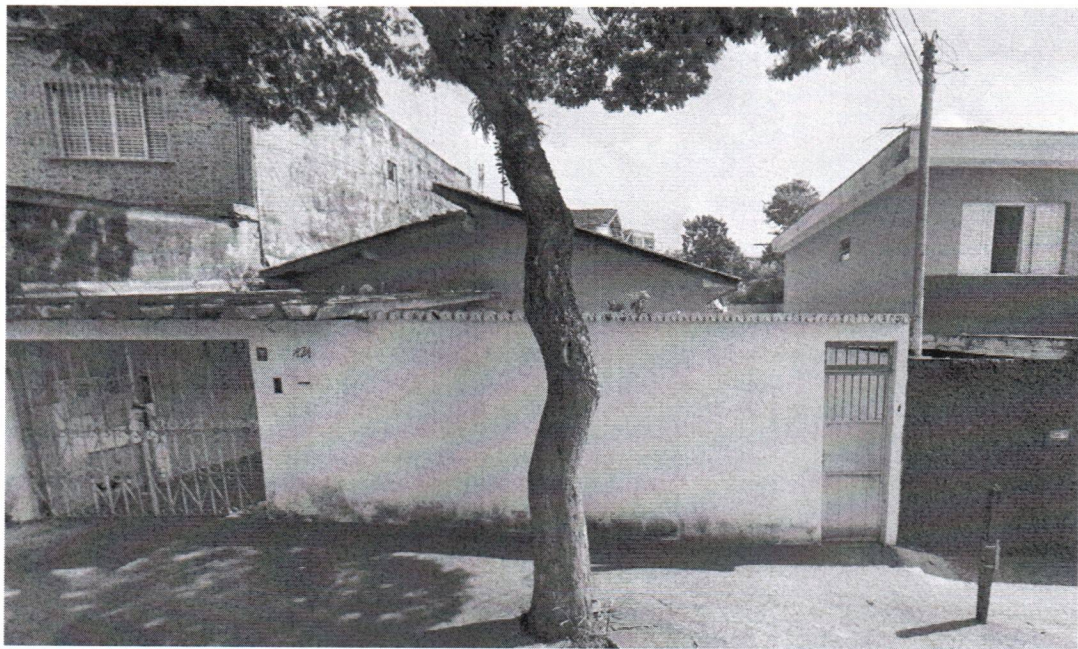
Rua Nemer Feres Rahall, 474 - Bairro Ferrazópolis