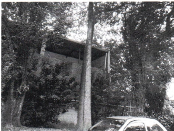
Fotos 1 a 6 – Av. Padre Anchieta, 834 – Jordanópolis – Remoção – SS 172111-2017 – EMEB Pe. Manuel da Nobrega